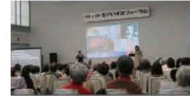
登録団体の活動などをパネル掲示